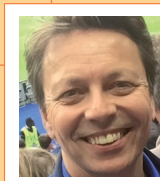
Pr PH. Touraine